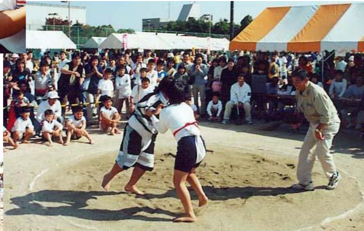
「はっけよい！」の声に力が入る