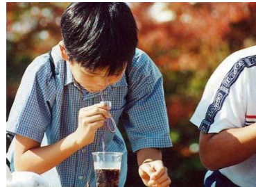
コーラ早飲み競争