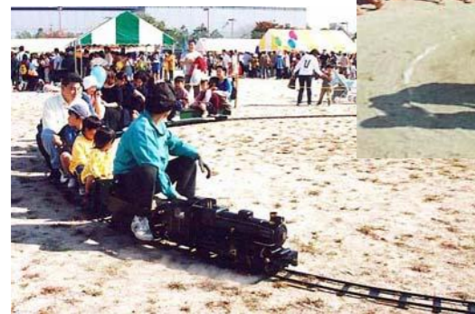
本物そっくりのミニSL

ホールでのふれあいステージのほか、野外ではわんぱく広場や大道芸広場などでいろいろなコーナーが用意されます。スピードくじやお楽しみ抽選会もあるよ。また、児童館こどもまつりも併設して行われる予定です。例年より少し時期が遅いので、防寒の用意をして行ったほうがいいのかも。